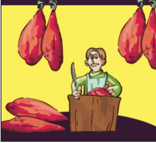
قصاب کی دکان