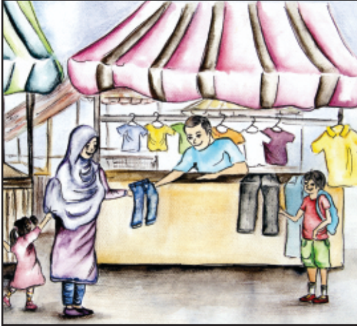
کپڑے کی دکان