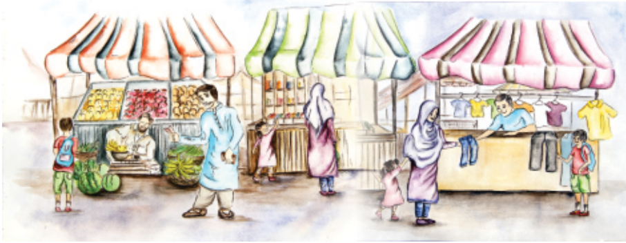
بازار میں مختلف دُکانیں

دُکان وہ جگہ ہے جہاں ضرورت کی چیزیں بکتی ہیں۔ ہر دُکان سے تمام ضروری چیزیں نہیں مل سکتیں۔ بازار وہ جگہ ہے جہاں ہر طرح کی دُکانیں ہوتی ہیں اور لوگوں کو ضرورت کی تمام چیزیں مل سکتی ہیں۔ دُکان دار لوگوں کی سہولت کے لیے مختلف چیزوں کی قیمتوں کی فہرست آویزاں کرتے ہیں۔