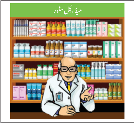
میڈیکل سٹور (دوائیوں کی دکان)