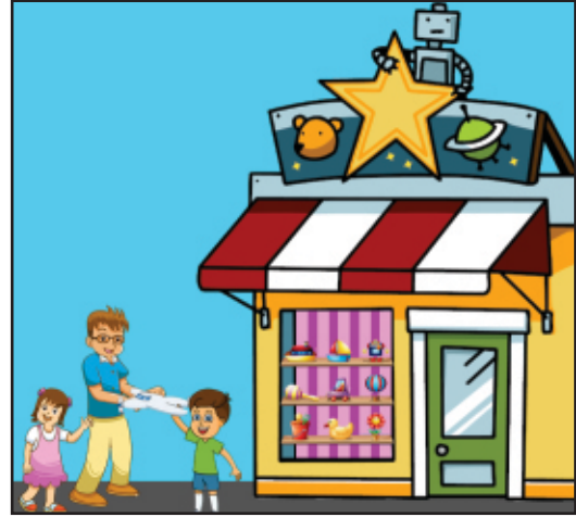
کھلونوں کی دکان